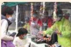
キャンディレイの販売