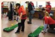
楽しいバターゴルフと輪投げコーナー

コロナ禍の中、縮小での開催となりましたが、たくさんの方に来場していただきました。キャンディレイとコーヒー販売は大盛況。集會室での輪投げとバターゴルフは盛り上がり、笑顔と歓声がいっぱいでした。