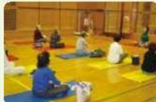
講師のお話を熱心に聞く参加者のみなさん。