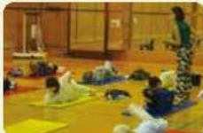
慣れないポーズにも挑戦します。