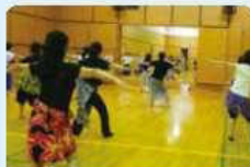
腰を使うのがポイントです。

腰だけを動かして踊るのは結構むずかしいですが、終わりに頃は皆さん楽しく踊っていました。