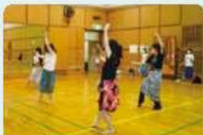
所作が美しく決まりました。