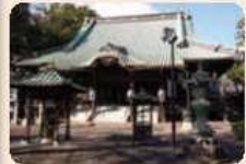
妙法寺の中心となる祖師堂