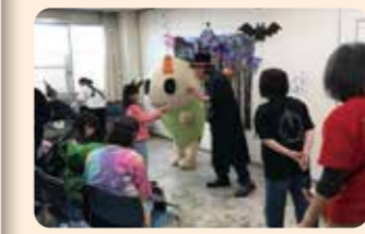
なみすけとフォトパーティーで写真撮影

定番の楽しいゲームや、キャラメルポップコーンなどの模擬店で今年も楽しんで頂きました。また、新たにハロウィンの仮装で「なみすけとフォトパーティー」を開催。子どもから大人まで、沢山の皆さまにご参加いただき、大盛況となりました。なみすけと仲よし写真も沢山撮れ、笑顔あふれたひと時を過ごせました。