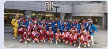
今年も一期一会で集った「おじゃま連」