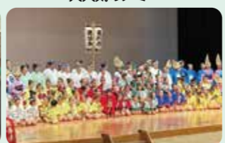
ちびっ子阿波おどり