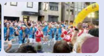
沿道の皆さんの温かい声援をもらい感動!