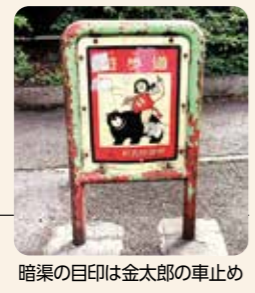
暗渠の目印は金太郎の車止め