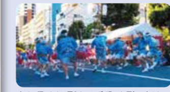
初めて踊ったとは思えないほど、明るく、元気に爽やかに

初心者ばかりが集まる大人気の体験講座「おじゃま連」です。熟練指導者のもと、数時間の練習で、本番の桃園演舞場・みなみ演舞場へ移動。カウントダウンを目のあたりにし緊張した面持ちでスタート。しかし、終わってみると「来年は友達を誘います」「今すぐ、どこかの連に入りたい」と、すっかり高円寺阿波おどりの虜に。猛暑の中、無事に祭りを終えられたのもひとえに、高円寺阿波おどり振興協会・ボランティア隊・温かい声援を送ってくださった観客の皆様のおかげです。来年も沢山の受講者をお待ちしております。