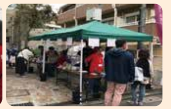
フランクフルトにキャラメルポップコーン