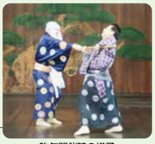
昨年開催時の様子