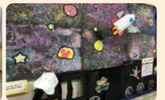
高円寺北子供園の園児による素敵な作品を展示

★こたえは「リンゴ」でした。赤(あか)い皮(かわ)をV(ブイ)の字(じ)に残(のこ)すウサギだね。