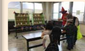
楽しい景品があたるスリル満点の射的