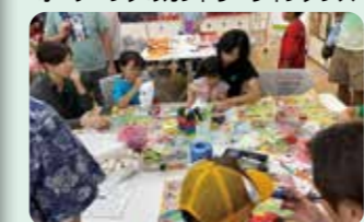
縁日で楽しく過ごしている子どもたち