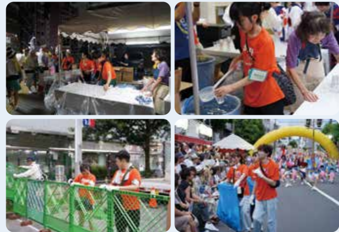
「ボランティアチームハピネス」

1957年(昭和32年)に一つの商店街の地域振興策として始まった「ばか踊り」。その後、近隣の商店街、町会・自治会に拡大、「高円寺阿波おどり」として65回の開催となりました。