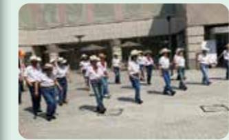
オープニングのカントリーラインダンス

2日目は子どもたちが活躍する「こどもフェア」です。中庭のちびっ子ダンス広場でスタート。なみすけ、ナミーも参加して大盛り上がりでした。ホールでは「踊れ!ちびっ子阿波おどり」で高円寺有名6連のちびっ子が元気に踊ってくれました。「高円寺を本の街にしたい」プロジェクト、災害時にも活躍する「FMすぎなみ」の杉並区・高円寺で活躍しているチームの紹介コーナーも大人気でした。