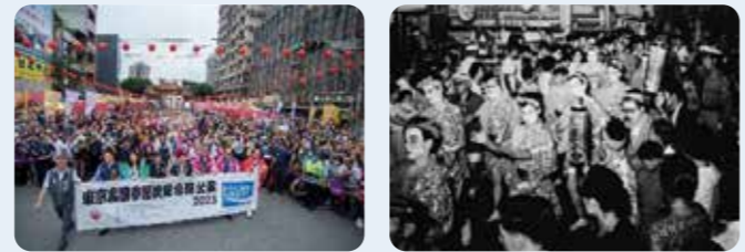
令和の高円寺阿波おどり 昭和30年代の高円寺阿波おどり

この方々のおかげで高円寺阿波おどりは昨年も大成功! 今年もお楽しみに!(開催は8月です)